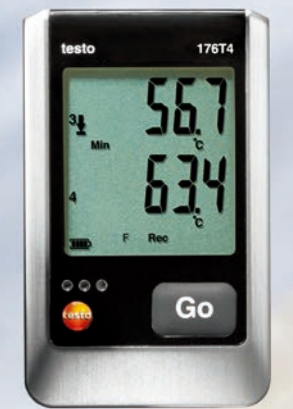
testo 176 专业系列