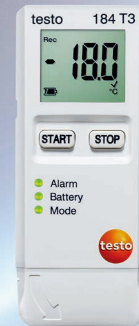
testo 184 USB型系列