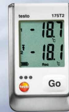
testo 175 精密系列