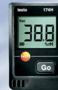
testo 174 迷你系列