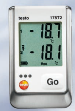
testo 175 精密系列