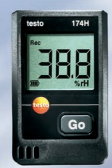
testo 174 迷你系列