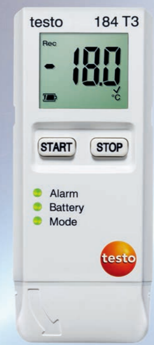
testo 184 USB型系列