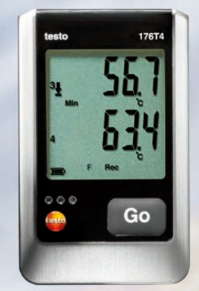
testo 176 专业系列